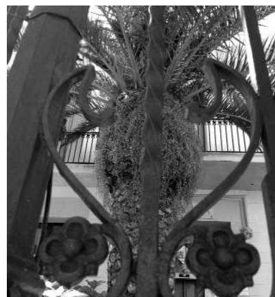
Treball de forja i palmeres, elements típics de les cases d'estil indià. Ajuntament de Begur

on ja feia un temps que el seu germà gran hi estava instal·lat. Van obrir tres comerços: una botiga de teixits que proveïa l'exèrcit espanyol, una botiga de vins i aiguardents i un basar d'armes. Molts van començar obrint petits cellers i venent productes d'ultramar.