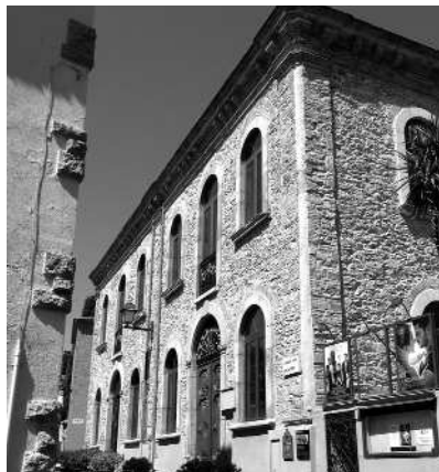
El casino dels senyors construït amb pedra vista per a fer "café, copa i puro".