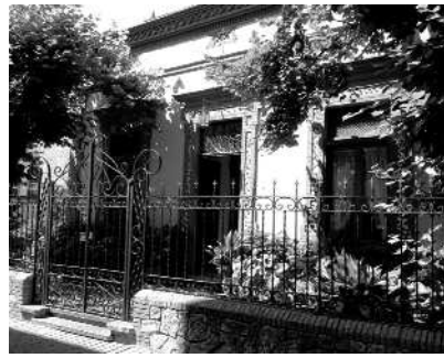
Can Paco Font, una de les poques cases modernistes de Begur.

8) La casa de Paco Font destaca pel trencadís del marc que decora portes i finestres. D'estil modernista, és una casa de planta baixa amb jardí a tot volt, tancat per una reixa de ferro forjat. Aquesta és una de les últimes cases que es van contruir un cop es van haver perdut les colònies espanyoles d'ultramar el 1898, temps en