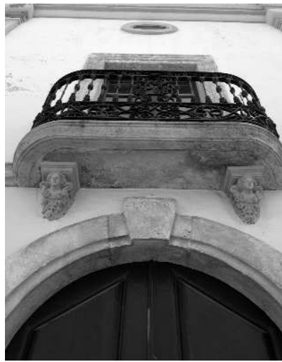
Casa Pere Roger on es pot veure en la clau de porta les inicials del seu propietari i l'any en que fou acabada. Planta baixa, pis i golfes.