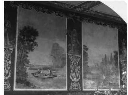
Pintures romàntiques situades sota la porxada Can Sora.