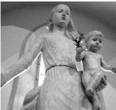
Preciosa escultura de la Verge del Corall de Francesc Fajula (1985) situada dins l'Església Parroquial de St. Pere de Begur.

7) Si tenim ganes de caminar podríem arribar-nos fins a l'ermite de Sant Ramon , des d'on s'obté una pa-